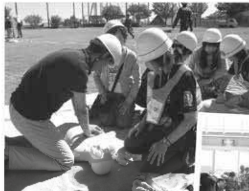
▲人命救助や土砂災害対策などの訓練は、さまざまな場面を想定し実施

地域の防災の取り組みをもっと知ってもらうため、近隣の小中学校と連携し、防災訓練と子どもたちの活動発表の場が一つになった、防災フェスティバルを毎年行っています。この企画のポイントは、発表会に出る子を見に来た友達や親が、自然と防災について考えられるようになっているところ。参加した方からは「AED（自動体外式除細動器）の使い方が勉強になった」などの声が寄せられていますよ。