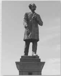
▲大通西10丁目にはケプロンの像が立つ

アメリカの農務長官であったケプロンは、開拓次官・黒田清隆に依頼されたため来日し、顧問として開拓の補佐や提案を行った。黒田に提出した意見書は半数以上が採用され、それを基に後の札幌農学校や、江別や小樽と札幌を結ぶ幌内鉄道が設置された。