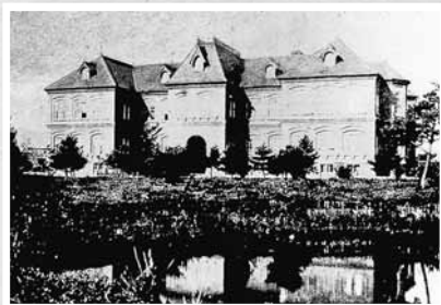
▲北海道庁本庁舎

北海道庁は1886年に札幌に設置され、開拓に尽力した岩村が初代長官に任命された。岩村はその後、製麻工場の設立や官営工場の払い下げなどを積極的に進め、札幌の経済の発展に大きく貢献した。