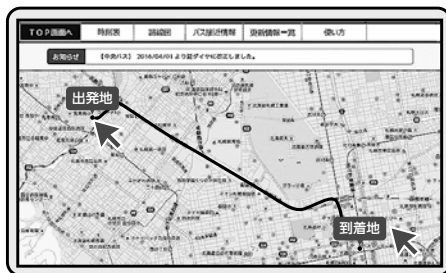
※リニューアル後のイメージ