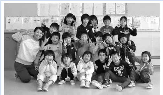
ねん くみ ともち せんせい 1年1組のお友達と先生

自分でひろったおち葉や実を付けて、楽しかったです。赤い実を付けてから、口を付けて顔にしました。みんな葉っぱを付けて、かわいいお正月かざりになっていました。