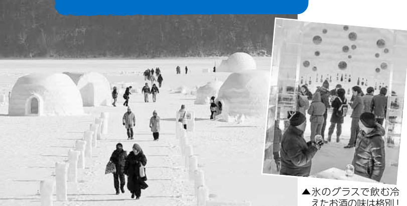
▲氷のグラスで飲む冷えたお酒の味は格別！

凍った湖の上に雪と氷だけで作られた世界が出現。然別湖から切り出した氷でできたバーで、カクテルや温かいココアを飲んだり、氷上露天風呂に入りながら絶景に癒やされたりできるイベントです。そのほか、スノーシューを履いて、ガイドと一緒に森を散策するなど冬ならではの体験ができます。