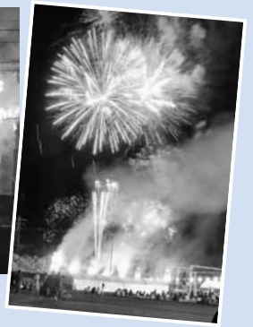
▲まつりの最後は約1,500発の花火が夜空を彩ります

日 8/14(日)13時~21時 所 上ノ国小学校グラウンド(上ノ国町字大留70) 問 同実行委員会 ☎0139-55-2311