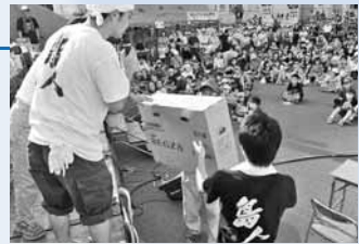
▲景品が当たるビンゴ大会も開催

町内外から多くの出店が集まり、ご当地グルメや特産品を堪能できるイベントです。きめが細かくジューシーな「おくしり和牛」をその場で食べられるのはこのお祭りだけ！奥尻ワインと共に味わうのもおすすめです。