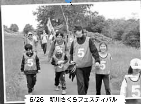
6/26 新川さくらフェスティバル ウォーキング～新川地区