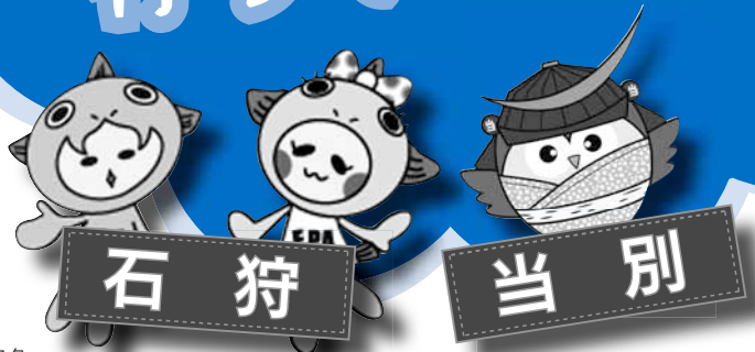
石狩市公認 キャラクター さけ太郎&さけ子