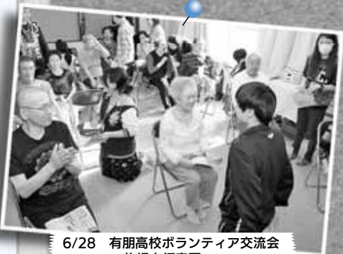
6/28 有朋高校ボランティア交流会 ～札幌市拓寿園