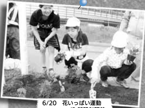
6/20 花いっぱい運動 ～JR 新琴似駅前