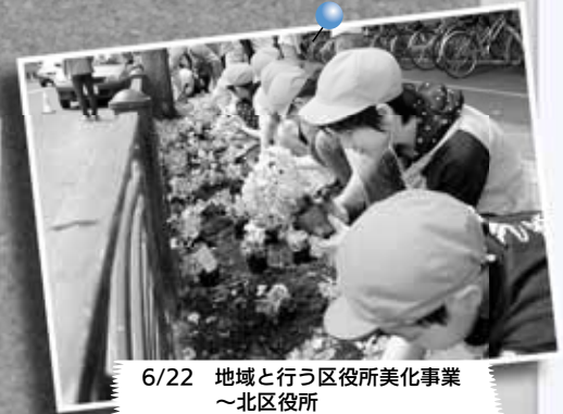
6/22 地域と行う区役所美化事業 ～北区役所