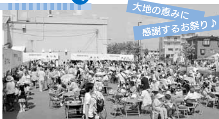
大地の恵みに 感謝するお祭り♪