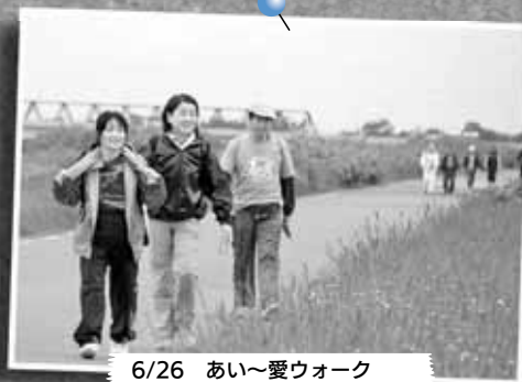
6/26 あい～愛ウォーク ～拓北・あいの里地区