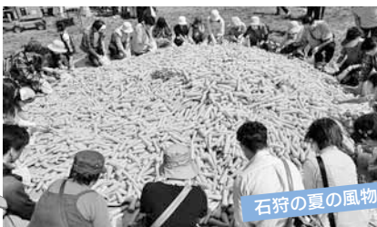
石狩の夏の風物詩!

石狩市の食材を使用した商品の販売のほか、来場者の方が参加できる催しが盛りだくさん。土曜日の夜には8,000発の花火がイベントを彩ります。