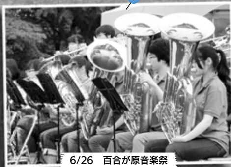
6/26 百合が原音楽祭 ～百合が原公園