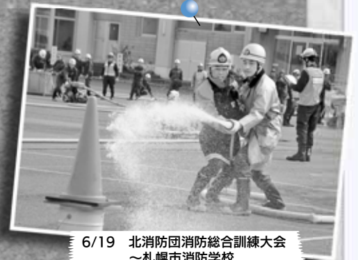
6/19 北消防団消防総合訓練大会 ～札幌市消防学校