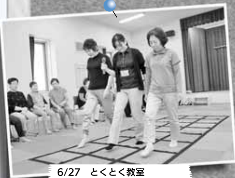
6/27 とくとか教室 ～新琴似双葉福祉会館