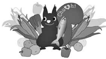
▲中央区食育マスコット「モリス」