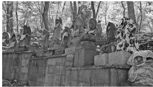
▲八十八の観音像を見ながら散策