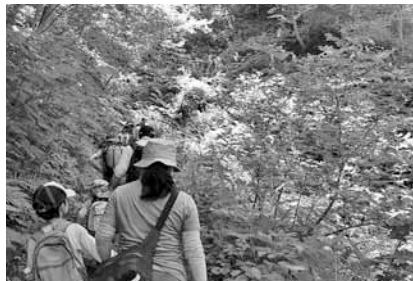
▲5つのコースがあり(左図)、体力などに応じて楽しむことができます