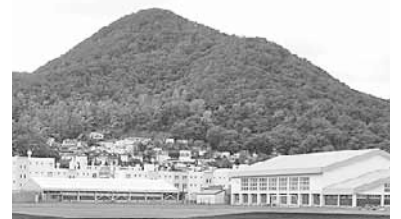
▲大人から子どもまで広く親しまれています

見る角度によって山体が三角形に見えるのが特徴で、アイヌ語名は「ハチャムエプイ」(発寒の小山)。1時間ほどで山頂まで登ることができるため、登山初心者にもお勧めです。