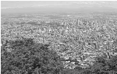
▲街並みを一望できる山頂には展望台やレストラン、登山客用の休憩室も完備