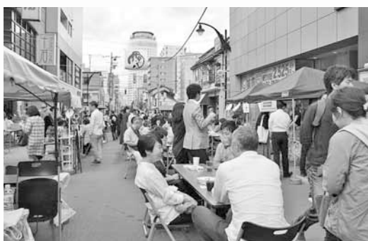
▲肩がぶつかり合うほどのにぎわい! (昨年の様子)