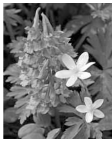
▲エゾエンゴサクとニリンソウ