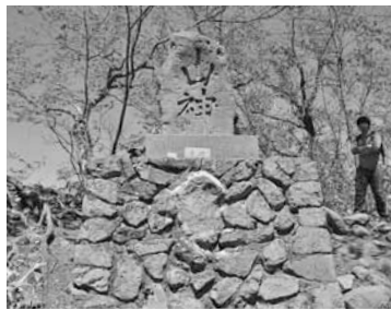
▲山頂に立つ山神碑

自然歩道では季節によって、いろいろな動植物に出会うことができます。一年を通し、さまざまな表情を楽しむことができるのも、魅力の一つです。