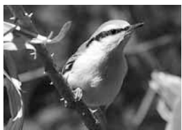
▲シロハラゴジュウカラ

自然歩道では季節によって、いろいろな動植物に出会うことができます。一年を通し、さまざまな表情を楽しむことができるのも、魅力の一つです。