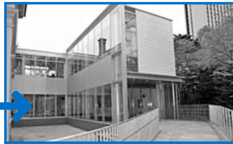
▲歴史を感じさせる本館とは対照的に近代的な外観の付属棟