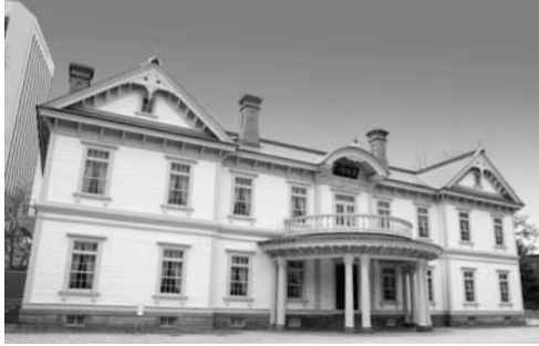
▲観覧・貸室利用は6/21(火)から開始

6月20日(月)に、中島公園内にある国指定重要文化財の豊平館が再オープンします。これは、豊平館を今後も安全に活用し続けるための耐震化工事が完了したことによるもの。改修に合わせて、文化財としての価値を高めるため、客室や装飾の修復を行い、明治13年にホテルとして建てられたころとほぼ同じ姿にしました。 これにより、日中は建物の美しさや特徴を体感できる観覧施設となり、夜間は広間などの貸室利用のみとなります。見どころが増えた豊平館を訪れてみてください。 詳細 豊平館 ☎(211) 1951