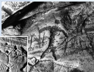
▲両手を広げた人の刻画 ◀翼の仮装をした人の刻画

1,500年～2,000年前に描かれた刻画が800以上見られる洞窟。刻画は仮装した人や舟、魚などさまざままで、国指定史跡にもなっています。