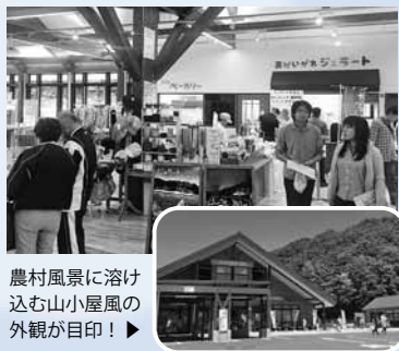
農村風景に溶け込む山小屋風の外観が目印!