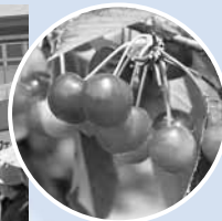
▲お祭り当日はさくらんぼの無料配布も実施