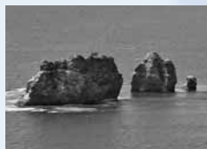
▲親子が寄り添うように見える奇岩は必見!