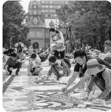
内花びらで大きな絵柄を制作。