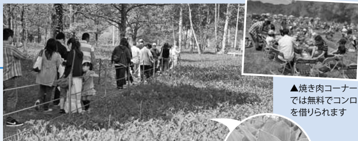
▲焼き肉コーナーでは無料でコンロを借りられます

日 観賞会は5/28~6/5の土・日曜10時~15時、群生地の一般開放は5/14(土)~6/12(日)6時~16時 所 芽生すずらん群生地(平取町芽生地区) 問 平取町観光協会 ☎01457-3-7703