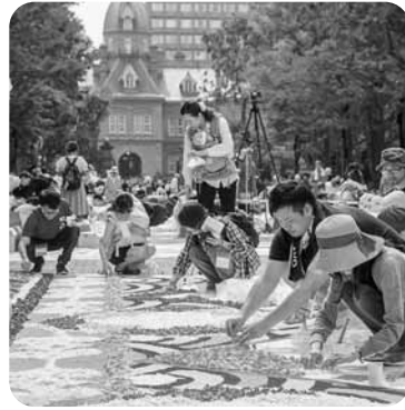
内花びらで大きな絵柄を制作。