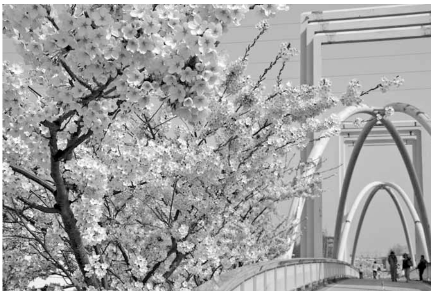
撮影日：平成27年4月27日 撮影場所：白石こころード