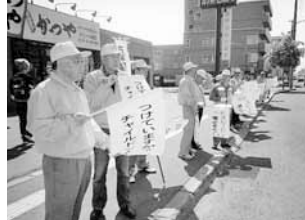
▲交通安全街頭啓発