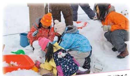
みんなで楽しく雪遊び!

※開催時間は会場によって異なります。詳細は1月中旬から区役所などで配布するチラシでお知らせします。