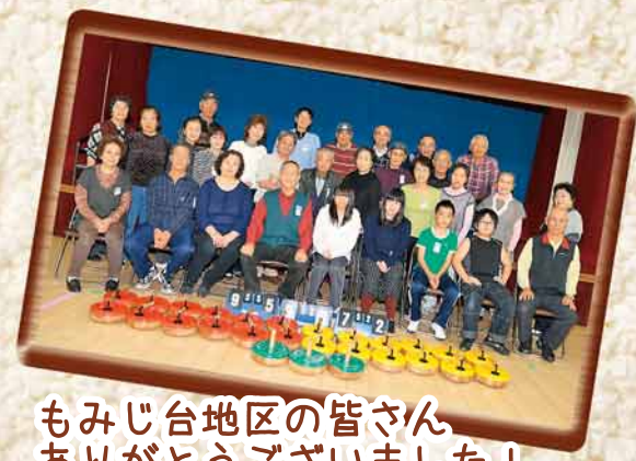
もみじ台地区の皆さん ありがとうございました！