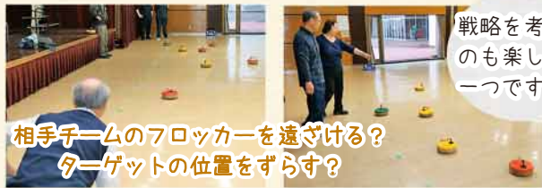
相手チームのフロッカーを遠ざける？ ターゲットの位置をずらす？

3 先攻チームから1投目のフロッカーを送球します。 2投目以降は、フロッカーがターゲットから遠いチームが送球します。