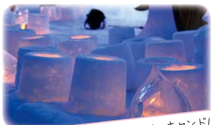
幻想的にきらめくスノーキャンドル