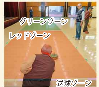
※実際はゾーンごとの色は付いていません。