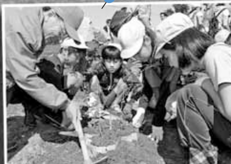
9/16 さっぽろふるさとの森づくり植樹祭&育樹祭 ～茨戸川緑地