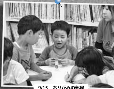
9/15 おりがみの部屋 ～太平児童会館