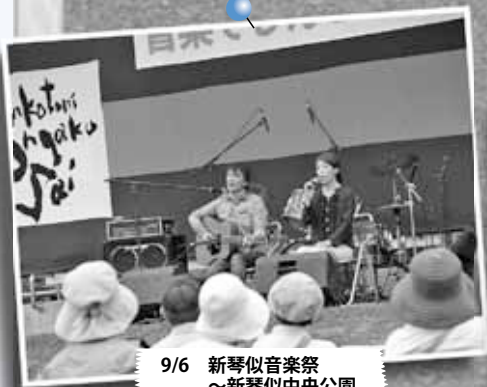
9/6 新琴似音楽祭 ～新琴似中央公園