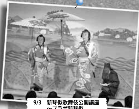
9/3 新琴似歌舞伎公開講座 ～プラザ新琴似