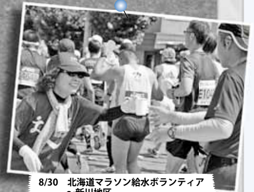
8/30 北海道マラソン給水ボランティア ～新川地区