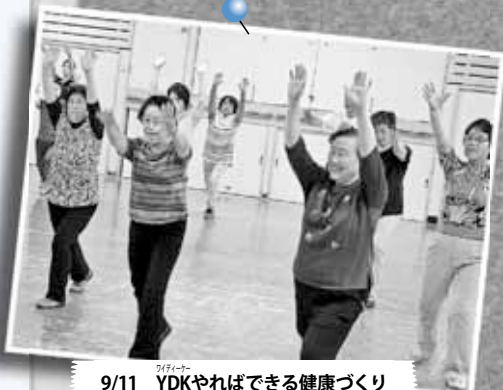
9/11 YDKやればできる健康づくり ～北区民センター