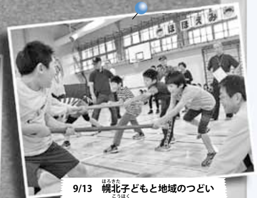
9/13 幌北子どもと地域のつどい ～幌北小学校