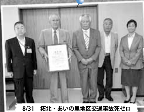
8/31 拓北・あいの里地区交通事故死ゼロ 1000日達成～北区役所