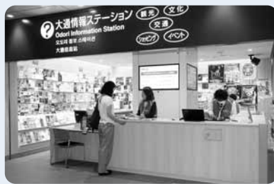
スタッフが常駐しており、英語、中国語の案内も行っていきます

観光、文化、音楽をはじめとするイベント情報や、交通機関の案内、都心部のお買い物情報などを知ることができる総合案内窓口です。ぜひ、ご利用ください。