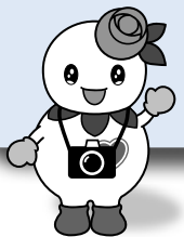
マスコットキャラクター「しろっぴー」

ご応募いただいた写真は、このコーナーや区役所ホームページなどで紹介します。募集要項は、区総務企画課広聴係と区内各まちづくりセンターで配布しているほか、区ホームページに掲載しています。内容を確認の上、ぜひご応募ください。