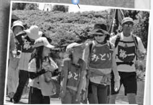
6/21 新川さくらフェスティバルウォーキング ～新川地区