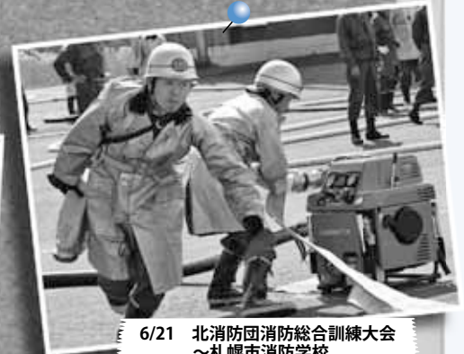
6/21 北消防団消防総合訓練大会 ～札幌市消防学校