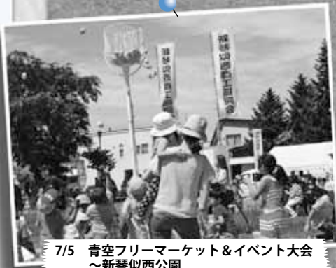
7/5 青空フリーマーケット&イベント大会 ～新琴似西公園