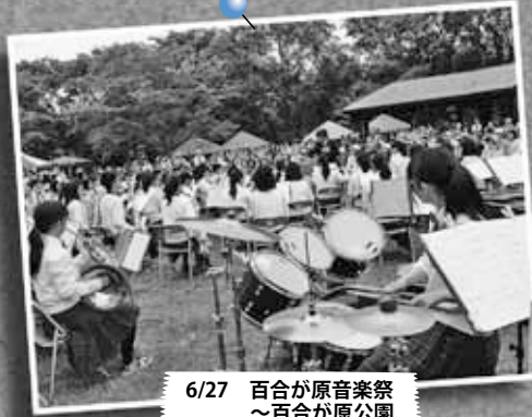
6/27 百合が原音楽祭 ～百合が原公園