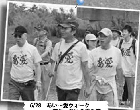
6/28 あい～愛ウォーク ～拓北・あいの里地区