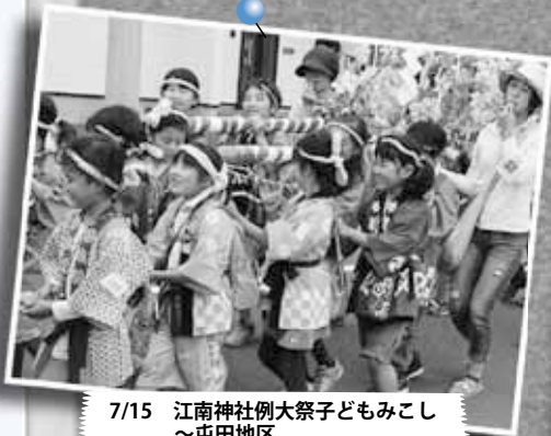
7/15 江南神社例大祭子どもみこし ～屯田地区