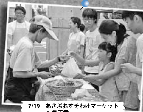
7/19 あさぶおすそわけマーケット ～寛王寺