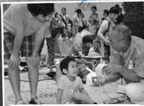
7/12 北区児童会館ファミリーフェスティバル ～ガトーキングダム