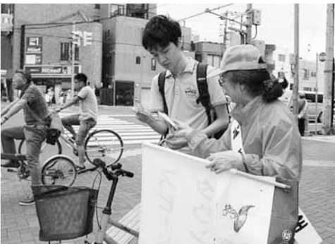
7月の啓発の様子。同会のほか、町内会女性部、地域の小中学校PTAなど、約30人が参加しました