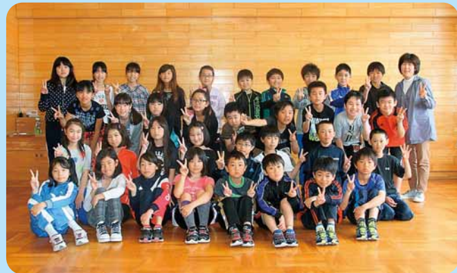
ねん く み と も だ ち せ ん せ い 5年1組のお友達と先生

私は、男の子が暑がっている様子をイメージして、うちわを作りました。紙粘土に絵の具を混ぜるのが楽しかったです。みんなも楽しんで作っていたので、笑顔いっぱいの夏のうちわがたくさんできました。