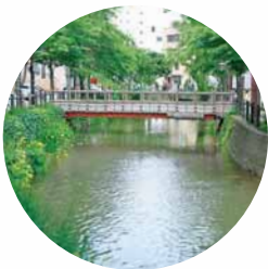
かもかもがわ ←鴨々川