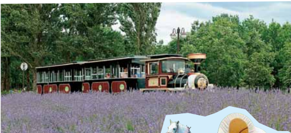
7月上旬はラベンダーが見頃を迎える

🏠 東区丘珠町584 🕒 9時～18時 📅 休 11/3(祝)までは無休 ☎ 787-0223 📖 17ページを参照