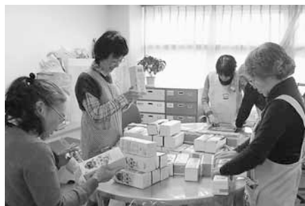
手作りおもちゃの会「つくろう会」

興味のある方は子育てボランティア講習会にぜひご参加ください！（今年度の講習会の案内は3ページにあります）