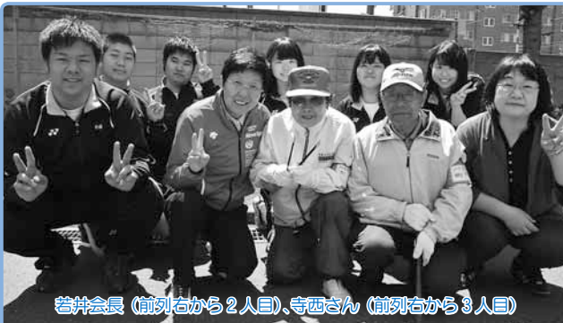
若井会長(前列右から2人目)、寺西さん(前列右から3人目)

6月6日(土)には、環状線と北斗高校周辺の花植え活動を町内会と北斗高校が合同で行う予定です。