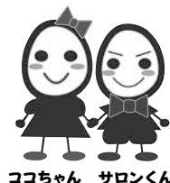
ココちゃん サロンくん