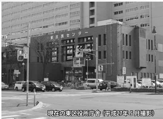
現在の東区役所庁舎(平成27年5月撮影)

区内の昔の街並みなどを紹介していく「ひがしくあところ」。 第2回は「東区役所庁舎」です。 昭和52年6月の庁舎完成時に、落成記念で植樹された木々の成長が、年月の経過を感じさせます。