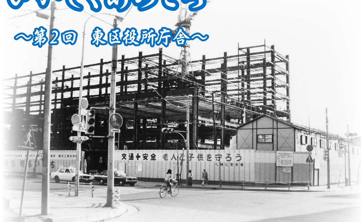
東区役所庁舎建設当時(昭和51年6月撮影)