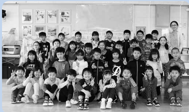
ねん くみ ともだち せんせい 3年3組のお友達と先生

色をつくるといろいろな色があるって気づきました。いろいろな形をいっぱい作って楽しかったです。色と形を作って書いた紙をかさにしておもしろかったです。みんないろいろな色を作っていて見て楽しそうでした。