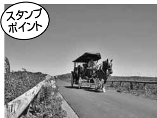
北見市・ワッカ原生花園