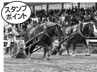
帯広市・ばんえい競馬