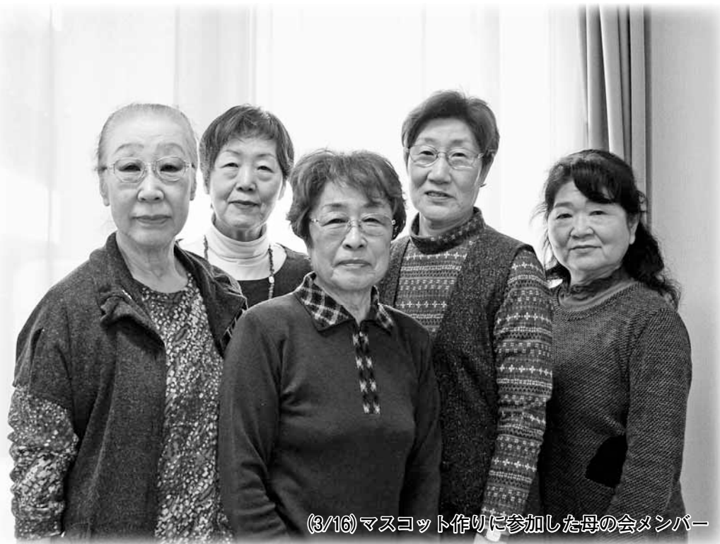
(3/16) マスコット作りに参加した母の会メンバー