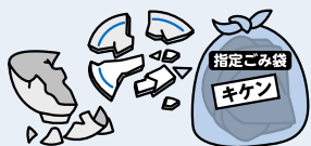
ガラス・せともの