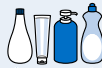
プラスチック製ボトル類