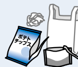
ポリ袋・ラップ類

食料品や日用品などが入っていたプラスチック製の容器・包装・緩衝材などで、使用後に不要となるものです。