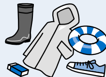
ゴム・ビニール製品