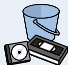
製品プラスチック