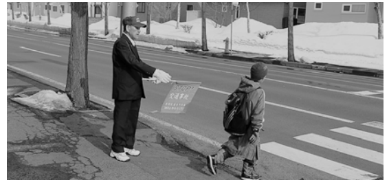
▲小学校の通学路に立ち、児童の安全を見守ります。

平成26年6月20日には、交通死亡事故「ゼロ」2,000日を達成。記録を1日でも伸ばし、地域を安全・安心なまちにするため、これからも日々活動していきます。