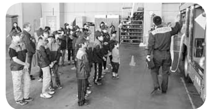
消防車見学の様子