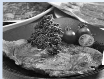
▲宗谷丘陵でのびのび育った宗谷黒牛

日本最北の豊かな自然に育まれた、選りすぐりの産品ばかりを集めた食品ブランド。認定品は原材料6品、加工品27品あります。稚内が誇る絶品グルメを味わってみて!