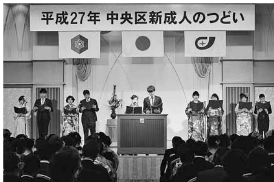
▲「わたしたちは、時計台の鐘がなる札幌の市民です。」