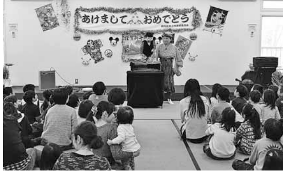
▲愉快的な掛け合いに子どもたちは大爆笑！