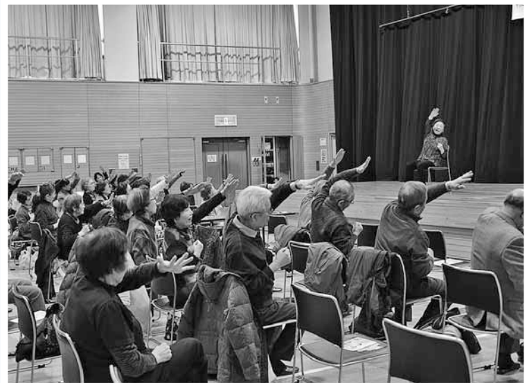
▲健康づくり交流会