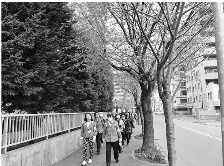
▲お花見ウォーキング