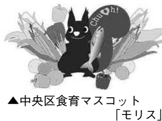
▲中央区食育マスコット「モリス」