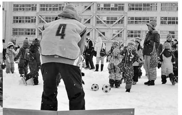
▲ゴールにシュート！入るかな？