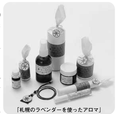
「札幌のラベンダーを使ったアロマ」

29製品を新たに認証。一部の製品は、1月1日(祝)から札幌スタイルショップ(中央区北5西2JRTタワー内)で購入できます。