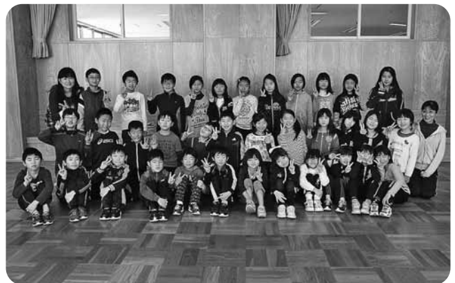
ねんくみ ともだち せんせい 3年1組のお友達と先生

わたし 私はガラスのびんで新年のかざりを作りました。思ったとおりにするのはむずかしかったけど、明るい感じになったのでよかったです。工夫したところは、いろいろな色を使って、はなやかにしたところです。