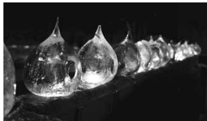
風船を使って作ったしずく型のアイスクャンドル。その光は周囲を優しく照らします

約1,500人が訪れる、冬の一大イベント。園内やその周辺に1,000個ものしずく型アイスクャンドルがとまります。餅つきや、かんじきを履いた野外散策など、家族で楽しめる催しもいっぱいありますよ。