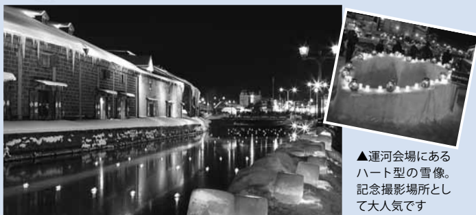
▲運河会場にあるハート型の雪像。記念撮影場所として大人気です

小樽の街並みを、たくさんの手作りキャンドルで照らし出す冬の祭典。数百の浮き玉キャンドルが見られる運河会場や、やわらかな光に包まれた雪のトンネルに入ることができる手宮線会場など、見どころが満載です。