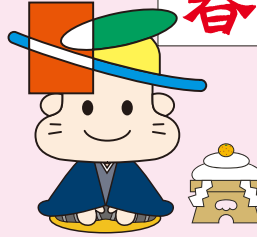
清田区マスコットキャラクター きよっち