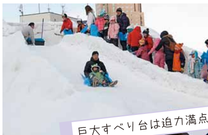
巨大すべり台は迫力満点！

地域の企業、団体、学生などが企画する手作りの冬のおまつりです。大人気の「巨大すべり台」や前回好評だった「ミニプラネタリウム」の他、今回はアンモナイトのレプリカ作りなどができる「体験コーナー」が新登場！2/1(日)には厚別公園競技場でもタイヤチューブすべりを同時開催！(有料)