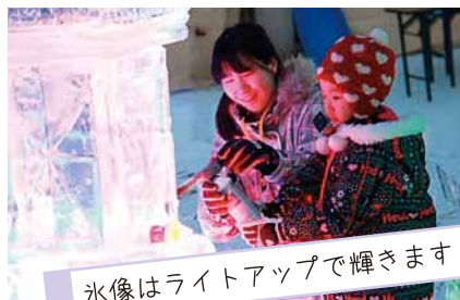
氷像はライトアップで輝きます！