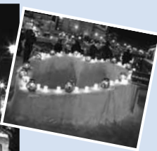
▲運河会場にあるハート型の雪像。記念撮影場所として大人気です

小樽の街並みを、たくさんの手作りキャンドルで照らし出す冬の祭典。数百の浮き玉キャンドルが見られる運河会場や、やわらかな光に包まれた雪のトンネルに入ることができる手宮線会場など、見どころが満載です。