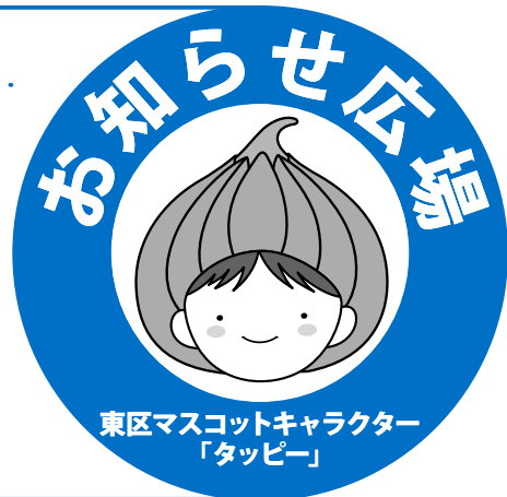
東区マスコットキャラクター「タッピー」