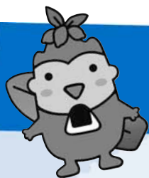
◀厚真町の公式キャラクター「あつまるくん」