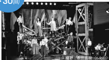
昨年のTGR大賞作品「ローザ・ルクセンブルク」(劇団千年王国)