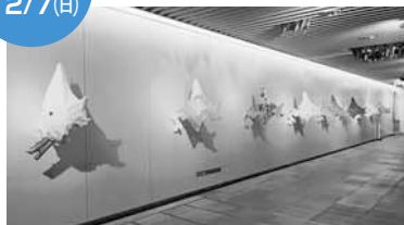
昨年の展示作品 Ezotic Troupe作「Ezotic Colors」