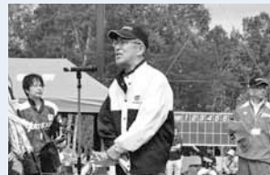
↑少年野球大会であいさつをする春山会長。