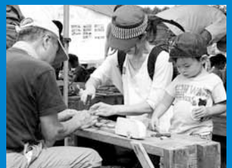
▲公園ボランティアと一緒に木の工作を楽しむ「アートで遊ぼう!」は子どもたちに大人気。

編集手稲区役所総務企画課広聴係 〒006-8612 札幌市手稲区前田1条11丁目 Tel:681-2432(直通) Fax:681-6639 ホームページ「ていねっていいね」 http://www.city.sapporo.jp/teine/