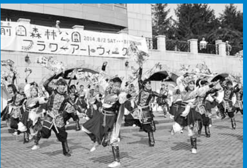
▲8月9・10日は、北海道科学大学や児童会館などによる多彩なステージ発表が行われました。