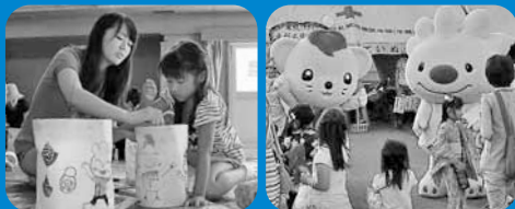
▲「第23回ていね夏あかり」が開催され、約1万個のちょうちんの明かりが会場のてっぽく・ひろばを幻想的に照らしました。