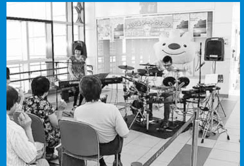
▲JR手稲駅自由通路「あいくる」で、音楽や読み聞かせなどを楽しむ「あいくるアートウィーク」が開催されました(8月16~31日)。