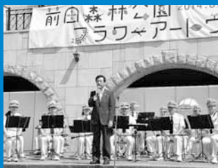
▲札幌市消防音楽隊のファンファーレに続き、秋元克広副市長による主催者あいさつ。