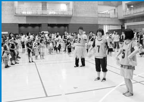
▲「手稲ばわふる☆きっずらんど」が北海道科学大学体育館で行われ、乳幼児から大人まで932人が楽しく遊びました(8月8日)。