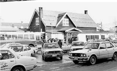
▲昭和52年の駅前の様子

JR手稲駅は、一日の乗降客数が北海道内で二番目に多く、約1万5千人の人々が行き交います。手稲の玄関口であるこの駅は、明治14年に「軽川(かろがわ)停車場(駅)」として開設されました。「軽川」というのは当時の駅周辺の地名。その由来は付近の川が、夏になると水が枯れるため「涸川(かろがわ)」と呼ばれ、それがなまったものと伝えられています。 昭和9年の駅舎の改築では、手稲パラダイスヒュッテを模した丸太小屋風の建物になりました。以来、約50年にわたって手稲の人々に親しまれま