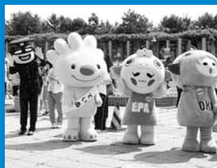
▲小樽市や石狩市から人気キャラクターたちが駆け付け、会場を盛り上げました。