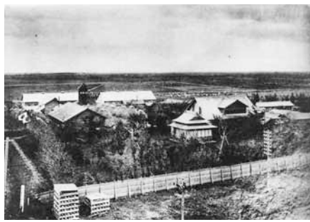
▲大正初期の前田農場

前田の地名は、昭和17年に手稲村の大字が廃止され、新たに12の字を定めたことによつて名付けられました。今は、住宅街になり、農場時代の面影は地名に隠れています。これからの前田地区の風景は、住宅街が広がる姿となるでしょう。