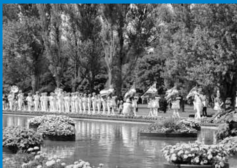
▲花が浮かぶ全長約600メートルのカナール(運河)沿いを4団体の約100人がパレードしました。