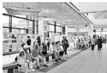
▲JR手稲駅自由通路「あいくる」の名称は、「会い」「愛」「来る」などに由来

した。かつては、駅長室に地域の人々が自然に集まり、社交場のような状態になっていたこともあったそうです。 「軽川駅」から「手稲駅」に名称が変更されたのは、昭和27年。その後、手稲町と札幌市との合併や都市開発の進展など、街が大きく発展しました。駅の乗降客も爆発的に増え、駅舎が手狭になり、昭和57年に建て替えられました。旧駅舎は移築されて喫茶店となり、平成11年までその姿が残っていたそうです。 現在の手稲駅の駅舎は4代目で平成14年に完成。駅の南北をつなぐ自由通路「あいくる」では、イベントなどが行われています。今も昔も手稲駅は、人々が交流する場所です。