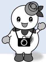
マスコットキャラクター「しろっぴー」

ご応募いただいた写真は、このコーナーや区役所ホームページなどで紹介します。募集要項は、区総務企画課広聴係と区内各まちづくりセンターで配布しているほか、区役所ホームページに掲載しています。内容を確認の上、ぜひご応募ください。