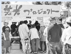
▲若者プロジェクト