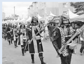
▲片倉鉄砲隊と甲冑武者