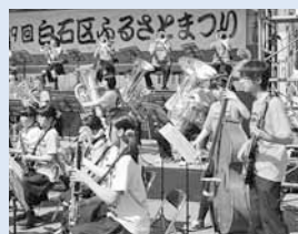
▲白石高校吹奏楽部