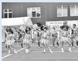
▲子ども遊芽カーニバル