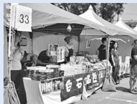
▲宮城県白石市物産品市