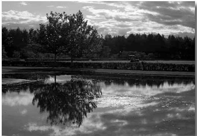
▲「ひとときの幻」 撮影場所：川下公園