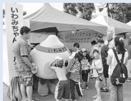
▲岩見沢市アンテナショップ