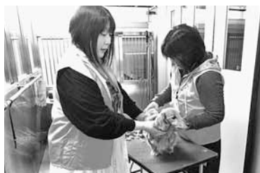
▲保護された犬を推進員がきれいにトリミング

市では、地域の動物愛護およびペットの適正飼育を推進するため、市長から委嘱を受けた「動物愛護推進員」が活動