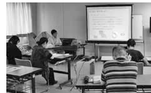
▲犬猫飼い方教室の様子