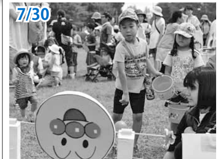
南沢ラベンダーまつり