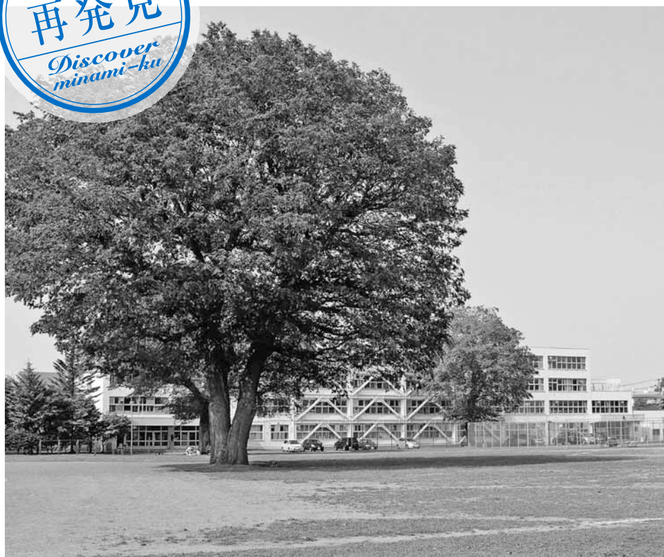
▲真駒内曙中学校のグラウンドの中央付近にあるハルニレの木。