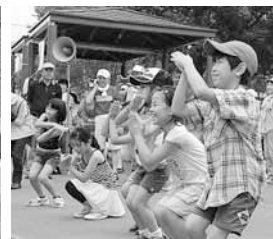
▲最後にみんなでダンス！

子どもたちの笑顔が輝く元気で楽しい祭りにしようとして取り組んでいます。来年も開催しますのでぜひお越しください。