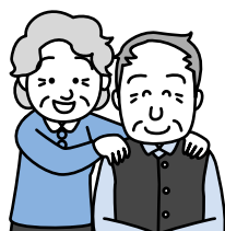
要援護者のご夫婦

厚別中央町内会連合会では、災害時に地域の人たちが支え合うためには、 日頃のつながりが大切 だと考え、昨年「防災・福祉支えあい活動」に取り組んでいます。