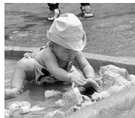
▲暑い日は水遊びコーナーが一番！

当日は、夏休み中の小・中学生や高校生もボランティアに加わり、ワイワイ楽しみながら子どもとふれあっています。