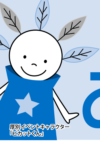
厚別イベントキャラクター 「ピカットくん」