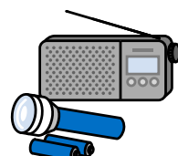
懐中電灯・ラジオ