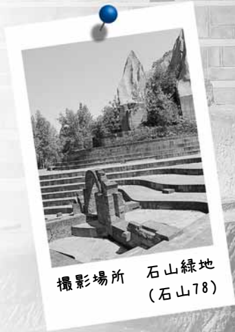
撮影場所 石山緑地 (石山78)