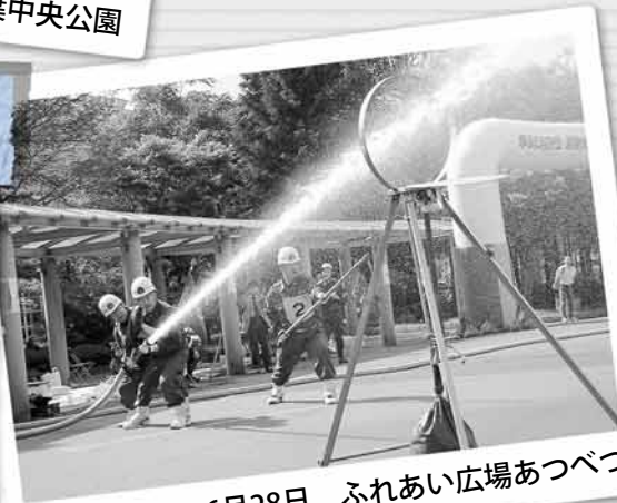
6月28日 ふれあい広場あつべつ

消火訓練では、4人1組の団員が消防用ホースを使い、火元を想定した的に向かって放水するまでの速さや正確さなどを分団ごとに競い合いました。