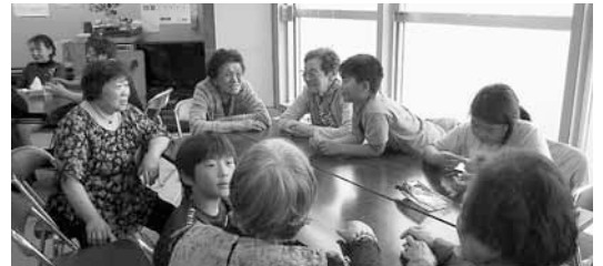
▲子どもたちも会場を訪れ、にぎわっています

地域での「ふれあい」をもっと広めていきたいですね。 もみじ台地区の皆さん お待ちしております。