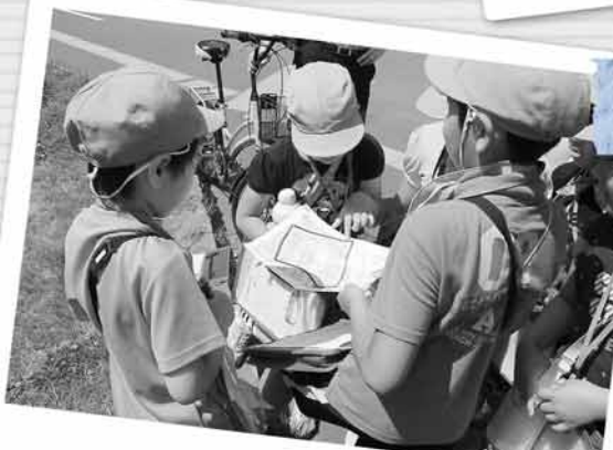
7月1日 共栄小学校付近

7月18日の授業参観では、児童たちが現地の情報を書き込んだメモと撮影した写真を基に作成した「地域安全マップ」を発表しました。