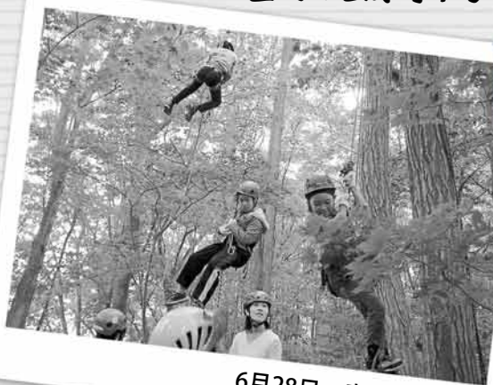
6月28日 青葉中央公園