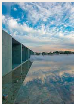
〈参考作品〉 中谷芙二子 「Fog Sculpture #47636 "風の記憶"」 2013 豊田市美術館での展示風景

芸術の森美術館中庭の壁面から人工 の霧が滝のように流れ、幻想的な光 景をつくり出します。風や湿度によ る変化に注目です。