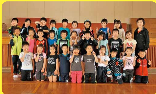
ねん くみ ともだち せんせい 2年2組のお友達と先生

ぼくは、ダイオウイカを作りました。モールで足を 作って、顔は紙で作って、最後にわた毛みたいな丸い 玉を口にしました。ぼくが作ったと思えないぐらい かっこいいです。「足がキラキラして、すごいや」と 思いました。