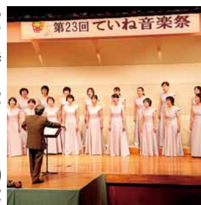
▲昨年の音楽祭の様子

出演日時 12月7日(日)12時30分～15時45分。 出演場所 区民センター2階区民ホール(前田1条11丁目)。 対象 区内で音楽活動をしている個人またはグループ25組程度(多数時抽選)。 ※カラオケ、民謡、25人以上の吹奏楽は除く。個人参加は2組まで。 費用 1人につき、大人700円、中高生300円、小学生以下無料。 申込 8月20日(水)までに市コールセンターへ電話、ファクス、Eメールで申し込み。 その他 演奏は生音のみ。楽器や機材は各自で用意。 (申込先・問い合わせ先) 市コールセンター(全市版1ページをご覧ください)