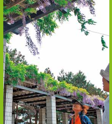
▲「前田森林公園ふじまつり」が開催されました (6月7、8日)。