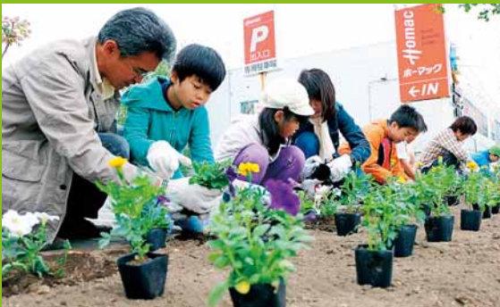
▲前田地区の11町内会が道道石狩手稲線沿いの植樹ますを色とりどりの花で飾りました (5月25日)。

人口140,762人 (前月比-57) 世帯数57,885世帯 (前月比+36) 平成26年6月1日現在