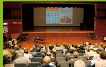
▲「手稲区防犯活動講習会」が行われ、地域で防犯活動に取り組んでいる約150人が参加しました (5月20日)。