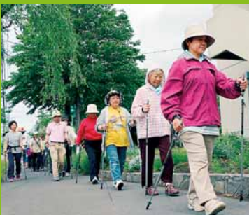
▲新発寒地区社会福祉協議会健康づくり委員会が「ノルディックウォーキング講座」を開催しました (6月9日)。