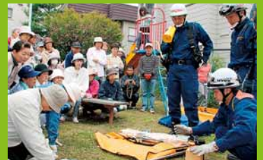
▲自主防災訓練が稲穂金山地区で行われ、参加者は防災への意識を新たにした (5月25日)。