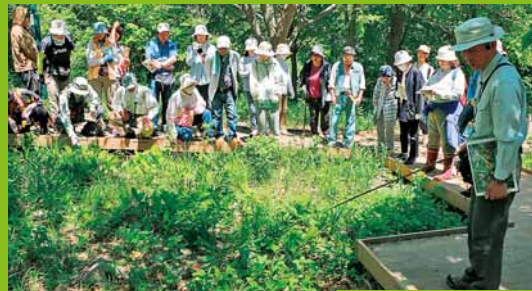
▲ニホンスズランの保全活動の成果を確認する自然観察会が富丘西公園で行われました (6月1日)。