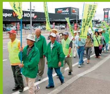
▲富丘西宮の沢地区の住民による不法投棄の撲滅を訴えるパレードが行われました (6月6日)。