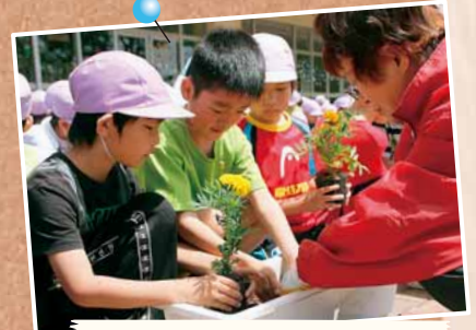
5/29 ボランティア団体との花植え ～篠路小学校