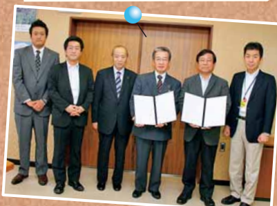
6/11 暁交通(株)との「災害時の輸送など安全で安心して暮らせるまちづくりを進める連携協定」～北区役所