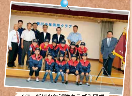
6/7 新川少年消防クラブ入団式 ～新川地区会館