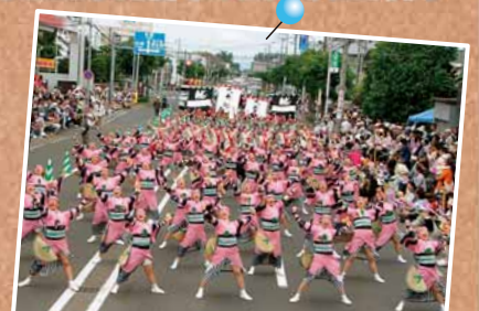
6/7 第23回YOSAKOIソーラン祭り ～新琴似会場