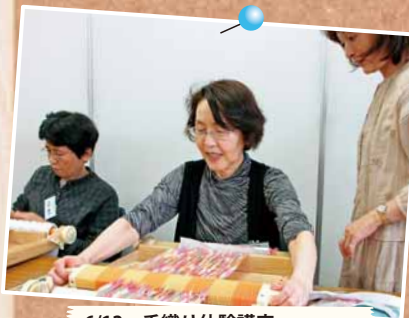
6/12 手織り体験講座 ～拓北・あいの里地区センター