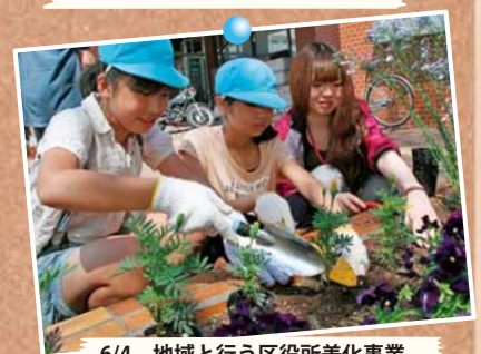
6/4 地域と行う区役所美化事業 ～北区役所