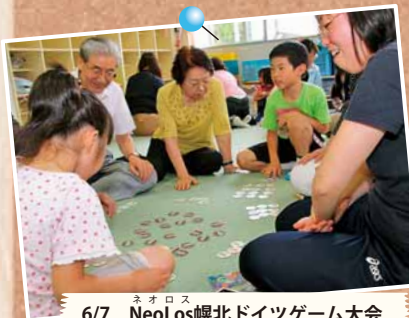
6/7 NeoLos ネオロス 幌北ドイツゲーム大会 ～幌北児童会館