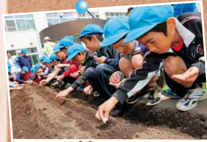
5/22 あさぶ あま 亜麻保存会による亜麻の授業 ～和光小学校