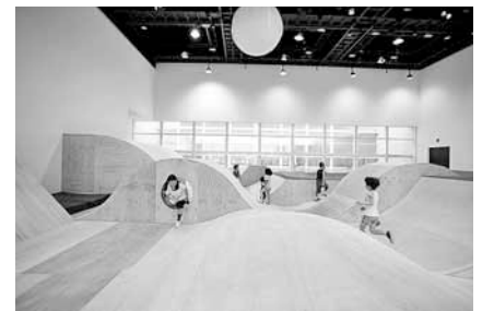
〈参考画像〉コロガル公園 2012年