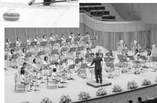
▲20年以上続いているフラワーコンサートは聴きごたえ抜群です！