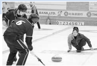
◀カーリング大会では白熱の勝負が繰り広げられます。

豊平区ゆかりの食材を生かした食育 「とよひら“風土 (food)”コレクション」