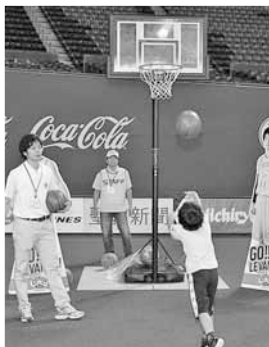
▲フリースロー、君は何本入られるかな？