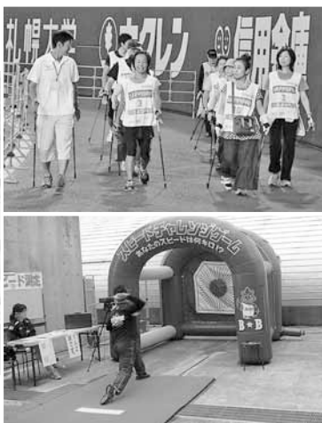
▲目指せプロ並み球速140km/h！